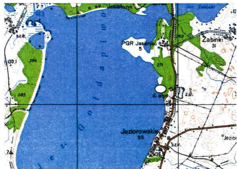
SZKIC ORIENTACYJNY skala 1:50 000

Słownie: dwa hektary sześć tysięcy siedemset siedemdziesiąt jeden m 2 .